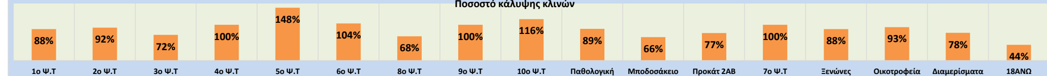
Ποσοστό κάλυψης κλινών