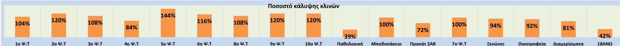
Ποσοστό κάλυψης κλινών

Παρατήρηση: 1 απαλλασσόμενος της ποινής κατά το άρθρο 69 του Π.Κ. σε απόδραση, 1 από το 4ο ΨΤΕ